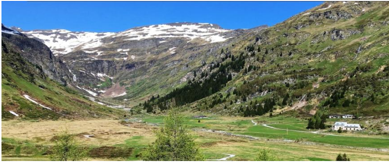
hinteres Gasteinertal - hinteres Gasteinertal - Nassfeld und Siglitztal