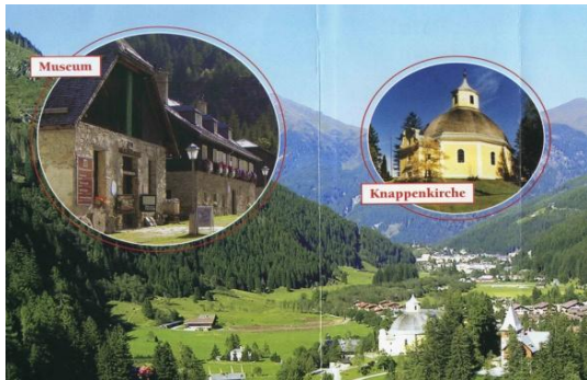
Altböckstein Museum und Kirche