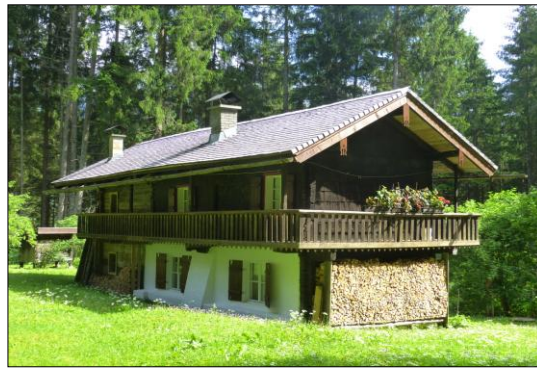
Knappenhaus Maria Opferung