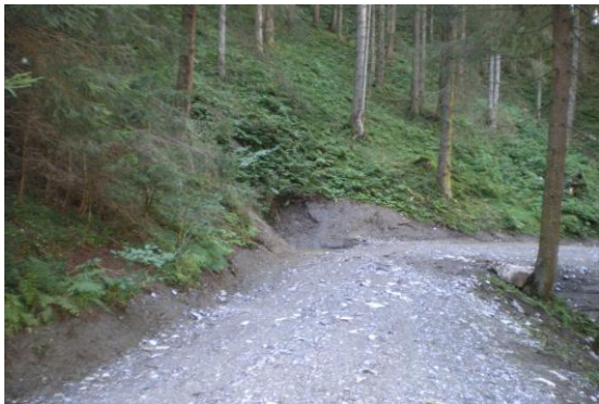
Die Reste vom Martinstollen am Knappenweg (Johanniweg)

Die Exkursion führt obertage vom Standort der Schwefelöfen und der Vitriolsiedehütte zur Mundlochpinge des Sigmund-Erbstollens, auf altem Knappenweg weiter zum Stollen Maria Opferung und den Halden (Pingen) des Daniel-, des Johann Baptist und des Martin Stollens. Von dort geht's weiter zum ersten Hüttenstandort (um 1425/30) und über Wens zurück zum Ausgangspunkt.